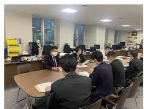
▲コロナ対策等について、道庁と積極的に意見交換