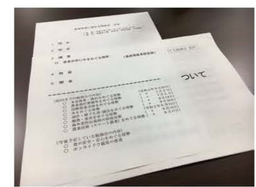
▲農業基盤整備、米政策などの農業政策や財政、教育、建設といった自民党・道民会議主催の勉強会に精力的に参加