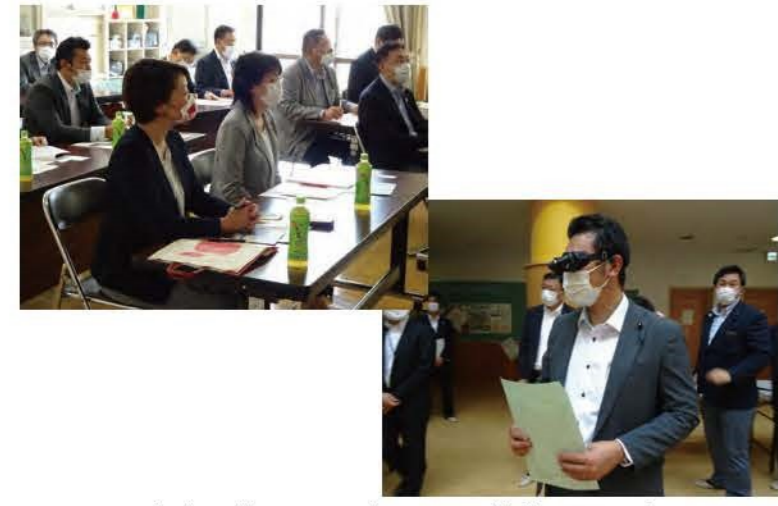
函館盲学校にて取り組みや学校施設を調査

同僚議員とともに、障がい者支援や農福連携の取り組みについて、現地へ赴き視察を行いました